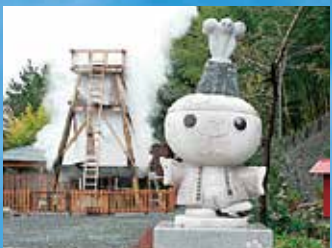
モニュメント「フントー君」