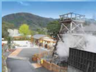
峰温泉大噴湯公園 全景